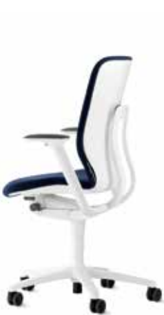
187/7 Drehstuhl, mittelhoher Rücken

Die Armlehnen lassen sich per Tastendruck um 100 mm in der Höhe anpassen. Optional sind die Armauflagen um 50 mm in der Tiefe und je 25 mm in der Breite verschiebbar (3-D-Funktion) und zusätzlich um 25° nach außen oder innen drehbar (4-D-Funktion).