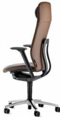
187/9 Drehstuhl, hoher Rücken mit Kopfstütze und Nackenkissen