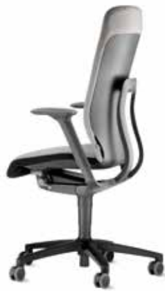
187/8 Drehstuhl, hoher Rücken