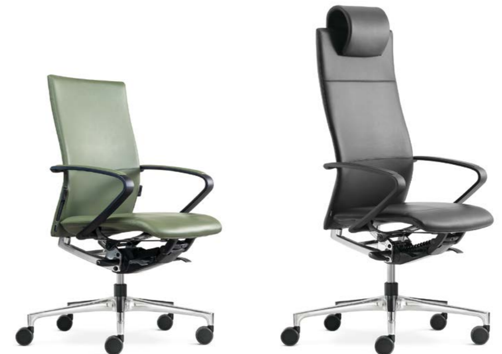
▲ CIELLO cie99 Bezugsstoff - Leder Premium Plus Upholstery fabric - Leather Premium Plus

The clear and consistent design of this office chair's curved backrest supports the spine for relief you can feel. The secret of its compact form lies in the innovative DLX® Duo-Latex upholstery in the seat and fully upholstered backrest.